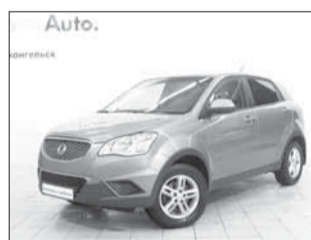
SsangYong Actyon (2012) 450 000 руб.