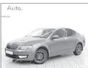
Skoda Octavia (2014) 695 000 руб.