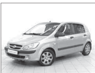
Hyundai Getz (2006) 175 000 руб.