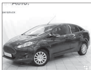
Ford Fiesta (2015) 585 000 руб.