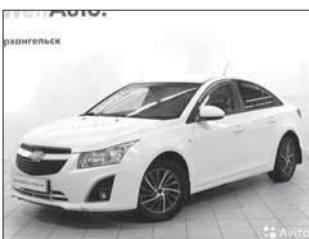
Chevrolet Cruze (2013) 480 000 руб.