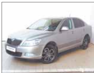
Skoda Octavia (2010) 449 000 руб.