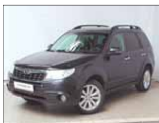
Subaru Forester (2012) 749 000 руб.