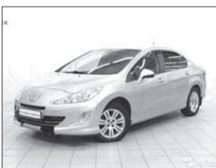
Peugeot 408 (2014) 375 000 руб.