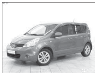
Nissan Note (2011) 380 000 руб.