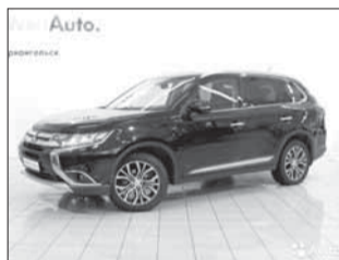
Mitsubishi Outlander (2015) 1 549 000 руб.