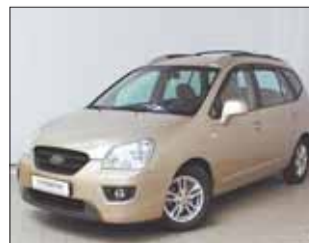
KIA Carens (2007) 355 000 руб.