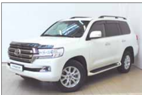
Lexus LX (2015)