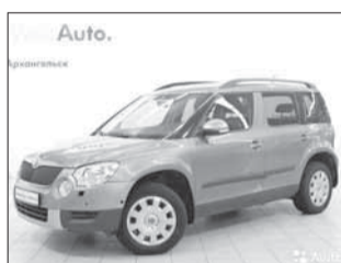
Skoda Yeti (2010) 335 000 руб.