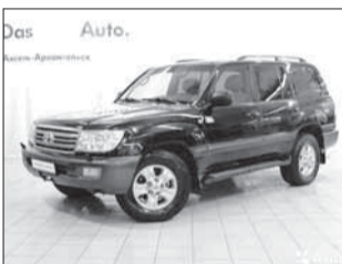
Toyota Land Cruiser (2006) 1 300 000 руб.