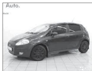
FIAT Punto (2006) 199 000 руб.