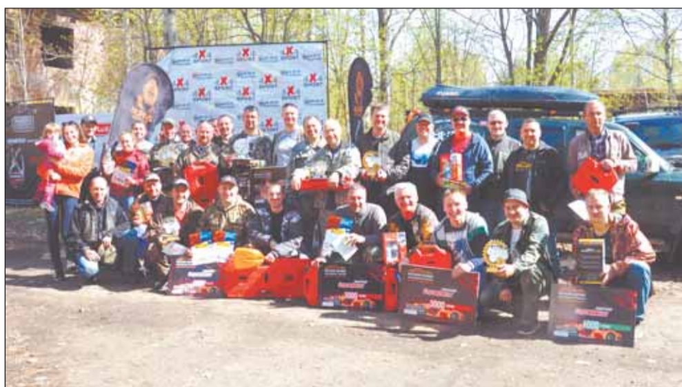
Результаты заезда в каждой категории и большой фоторепортаж смотри в группе «АВТОгазеты» ВКонтакте – vk.com/autogazeta29

В этом году трасса была настолько сложной, что понять по точке, для какой категории она установлена было практически невозможно.