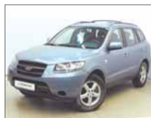
Hyundai Santa Fe (2007) 490 000 руб.