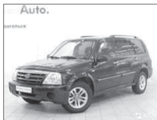
Suzuki Grand Vitara (2004) 290 000 руб.