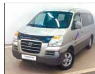
Hyundai Starex (2007) 575 000 руб.