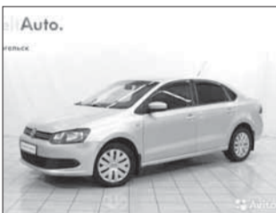
Volkswagen Polo (2012) 330 000 руб.

г. Архангельск, Окружное шоссе, 5. +7 (8182) 42-99-99 с 9.00 до 21.00