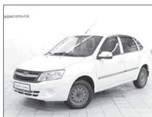
LADA Granta (2013) 270 000 руб.