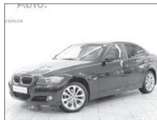
BMW 3 серия (2009) 470 000 руб.