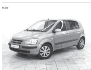
Hyundai Getz (2003) 135 000 руб.