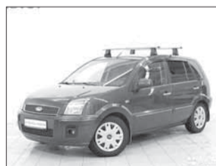
Ford Fusion (2010) 280 000 руб.