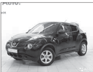
Nissan Juke (2013) 569 000 руб.