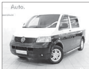
Volkswagen Transporter (2007) 500 000 руб.