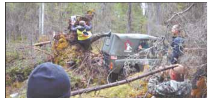
Задача – взять точки, остальное – нюансы!