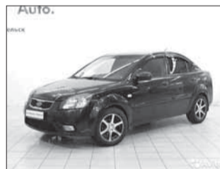
KIA Rio (2009) 309 000 руб.