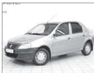
Renault Logan (2012) 210 000 руб.