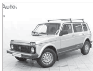
LADA 4x4 (Нива) (2011) 220 000 руб.