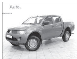
Mitsubishi L200 (2008) 560 000 руб.