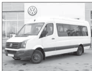
Volkswagen Crafter (2013) 1 175 000 руб.