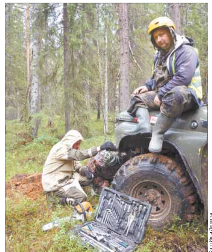
Ремонт внедорожников осуществлялся буквально на ходу. Чтобы не терять драгоценное время, команда из Вельска ставит на место лопнувшую рулевую тягу. К слову, сварили деталь прямо в лагере при помощи трех АКБ.