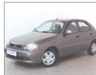
3A3 Chance (2012) 150 000 руб.