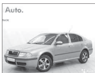
Skoda Octavia (2010) 290 000 руб.