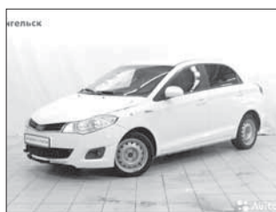
Chery Bonus (A13) (2011) 120 000 руб.