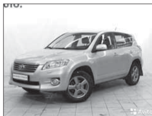
Toyota RAV4 (2012) 975 000 руб.