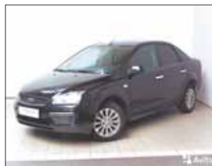
Ford Focus (2006) 249 000 руб.