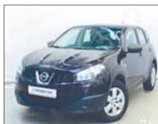
Nissan Qashqai (2013) 595 000 руб.