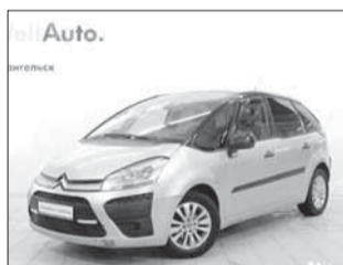
Citroen C4 Picasso (2009) 270 000 руб.