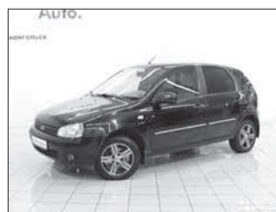
LADA Kalina (2011) 190 000 руб.