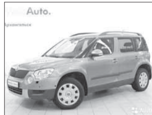
Skoda Yeti (2010) 399 000 руб.