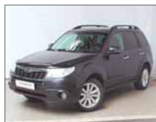
Subaru Forester (2012) 749 000 руб.