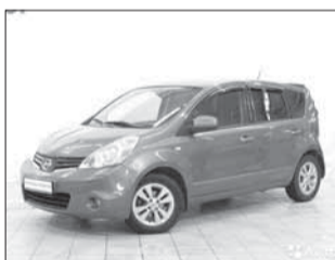
Nissan Note (2011) 390 000 руб.