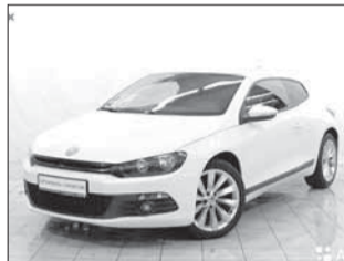
Volkswagen Scirocco (2010) 525 000 руб.