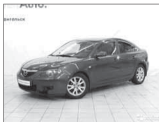
Mazda 3 (2007) 285 000 руб.