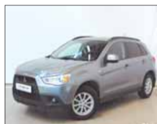
Mitsubishi ASX (2012) 655 000 руб.