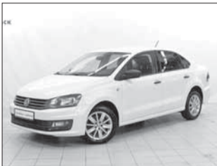
Volkswagen Polo (2016) 520 000 руб.

г. Архангельск, Окружное шоссе, 5. +7 (8182) 42-99-99 с 9.00 до 21.00