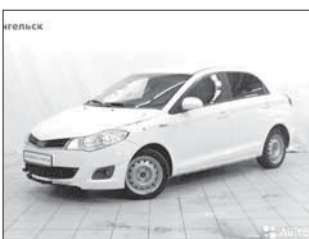
Chery Bonus (A13) (2011) 130 000 руб.