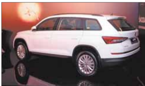
В качестве опций доступны третий ряд сидений, панорамная крыша с электроприводом, адаптивный круиз-контроль, система Light Assistant, ассистент движения по полосе Lane Assist, обогрев лобового стекла и рулевое колесо с подогревом.