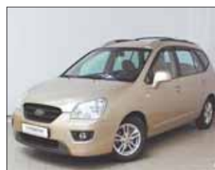
KIA Carens (2007) 365 000 руб.