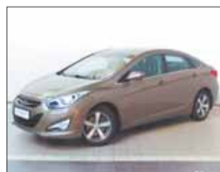
Hyundai i40 (2013) 785 000 руб.