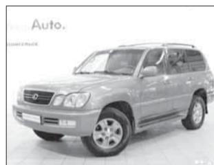
Lexus LX (2000) 775 000 руб.