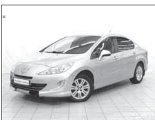
Peugeot 408 (2014) 390 000 руб.