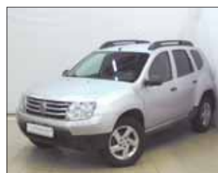
Renault Duster (2013) 499 000 руб.