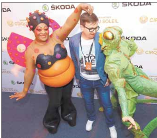
Шоу Цирка дю Солей OVO предлагает зрителям погрузиться в потаенную экосистему: скрытый мир обаятельных жуков и пауков у наших ног предстает перед нами нежным и страстным, шумным и спокойным, мирным и хаотичным.

– Старт продаж ŠKODA KODIAQ локального производства – это долгожданное и очень важное событие в истории нашей компании. Это также существенный шаг вперед в реализации кампании по освоению сегмента SUV. Благодаря расширенной линейке двигателей и комплектаций ŠKODA KODIAQ станет ближе и доступнее для наших клиентов. Я чрезвычайно рад этому событию и надеюсь, что модель теперь будет пользоваться еще большей популярностью у российских потребителей и их семей.