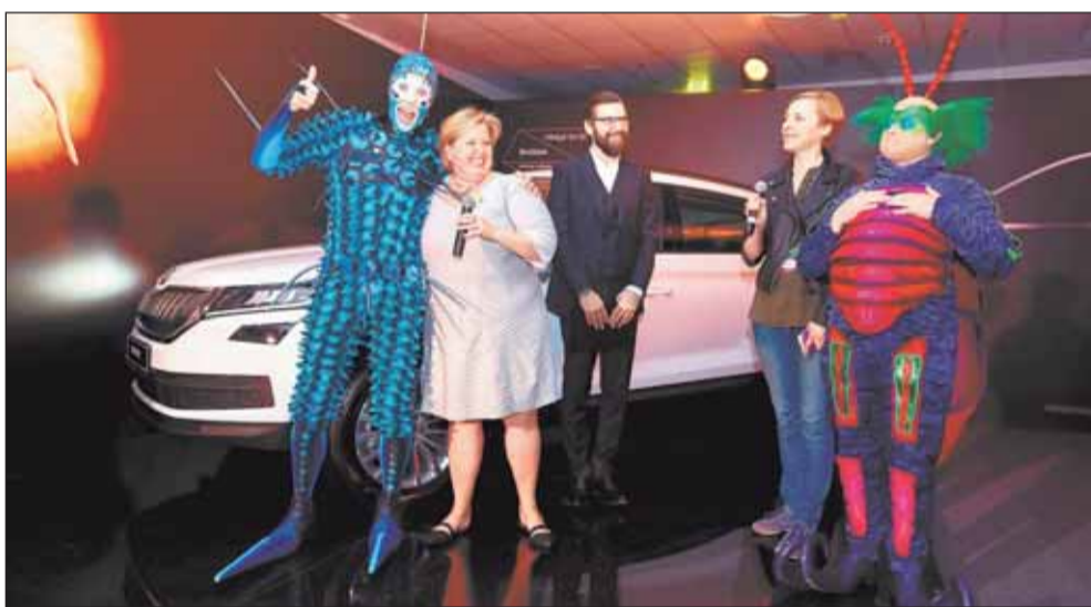
Сотрудничество ŠKODA и Cirque du Soleil началось в 2017 году, когда бренды заключили соглашение о партнерстве на международном уровне. Компании объединяют общие ценности и идеи, это в первую очередь стремление к абсолютному совершенству и исключительному качеству, превосходящему все ожидания.

В базовое оборудование ŠKODA KODIAQ локального производства входит 3-спицевое кожаное рулевое колесо, передние сиденья с подогревом, задние светодиодные фонари, двухзонный климат-контроль