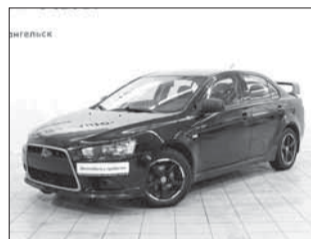
Mitsubishi Lancer (2014) 520 000 руб.