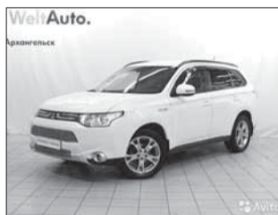
Mitsubishi Outlander (2013) 1 045 000 руб.