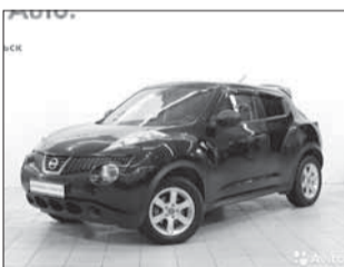
Nissan Juke (2013) 575 000 руб.