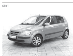
Hyundai Getz (2003) 135 000 руб.