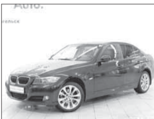
BMW 3 серия (2009) 520 000 руб.