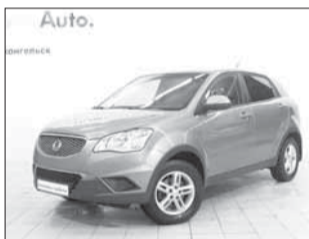
SsangYong Actyon (2012) 490 000 руб.