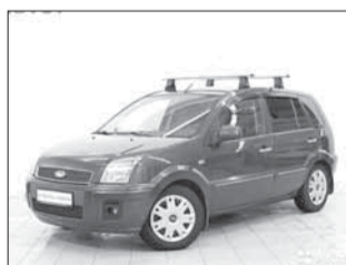
Ford Fusion (2010) 280 000 руб.