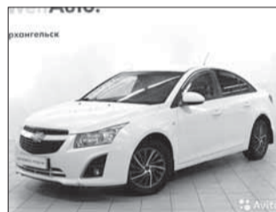
Chevrolet Cruze (2013) 490 000 руб.