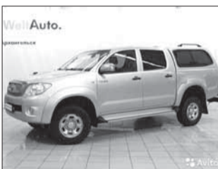
Toyota Hilux (2011) 1 130 000 руб.