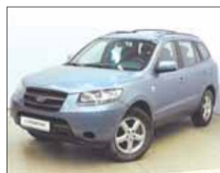
Hyundai Santa Fe (2007) 520 000 руб.