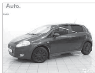
FIAT Punto (2006) 199 000 руб.