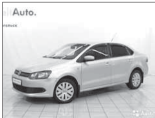
Volkswagen Polo (2012) 330 000 руб.