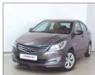
Hyundai Solaris (2015) 469 000 руб.