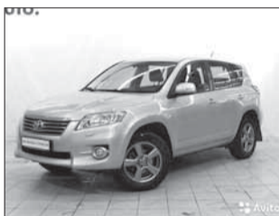
Toyota RAV4 (2012) 990 000 руб.