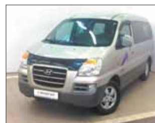
Hyundai Starex (2007) 585 000 руб.