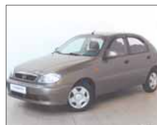
3A3 Chance (2012) 169 000 руб.