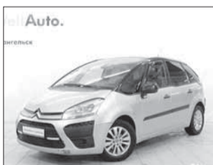
Citroen C4 Picasso (2009) 280 000 руб.