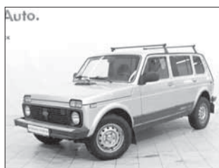
LADA 4x4 (Нива) (2011) 245 000 руб.