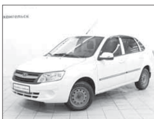
LADA Granta (2013) 270 000 руб.