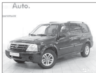
Suzuki Grand Vitara (2004) 299 000 руб.