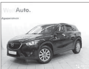
Mazda CX-5 (2014) 1 210 000 руб.