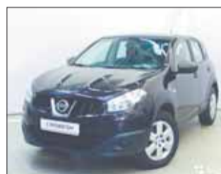
Nissan Qashqai (2013) 620 000 руб.