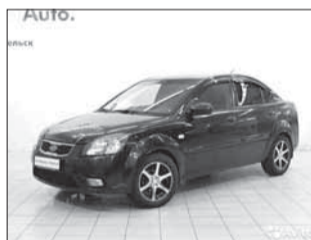
KIA Rio (2009) 309 000 руб.