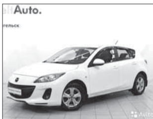
Mazda 3 (2012) 485 000 руб.